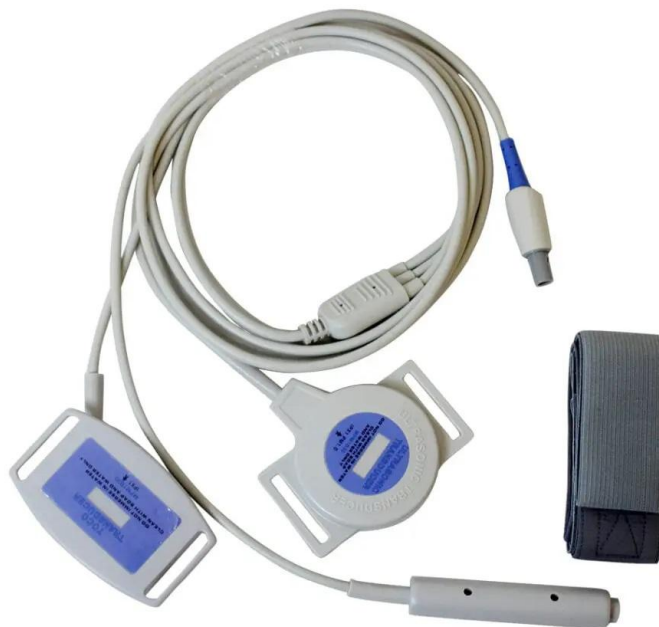
LKB-01: Cintas abdominales

BRUMED S.R.L Lavalle 1290 Piso 4 Of 408 (1048) Capital Federal Tel/Fax: +54 11 4381-8902 info@brumed.com.ar www.brumed.com.ar