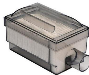
1.2.17.00024: Filtro Bacteriologico